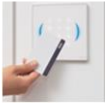
運用者用ICカードで 個人認証