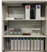
運用者は付与された 開錠権限により扉を開ける