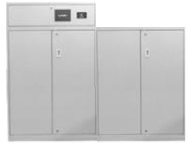
タイプC 連結タイプ